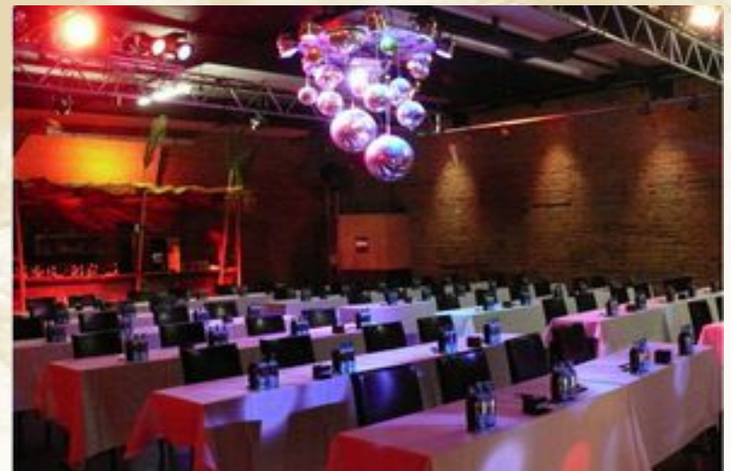
Nicoletta Bäuerle - Veranstaltungskauffrau