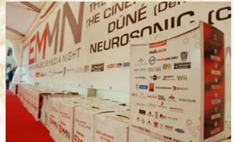
Nicoletta Bäuerle - Veranstaltungskauffrau