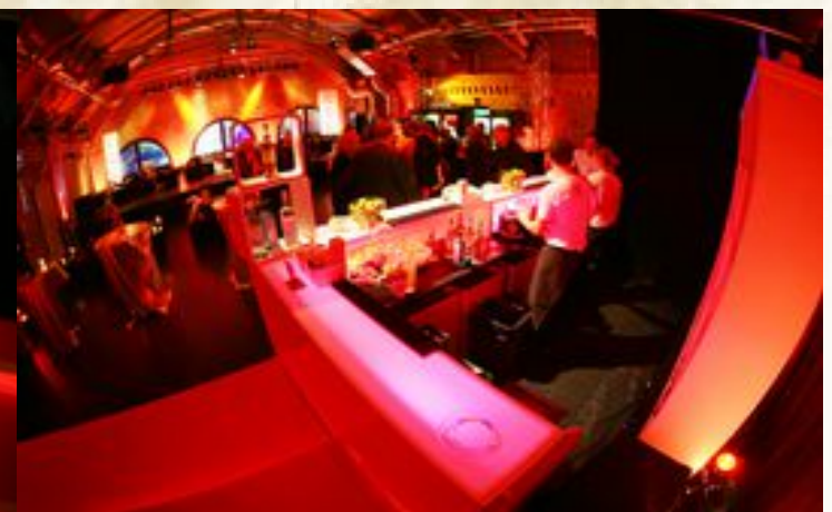
Nicoletta Bäuerle - Veranstaltungskauffrau