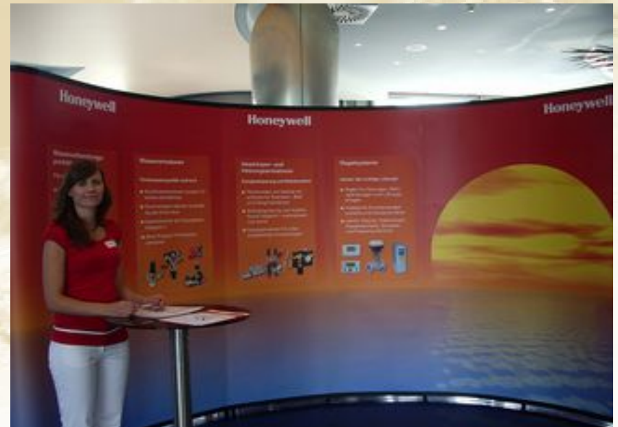
Nicoletta Bäuerle - Verkaufsfrauentätigkeit