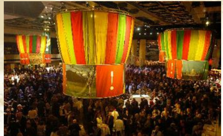
Nicoletta Bäuerle - Veranstaltungskauffrau