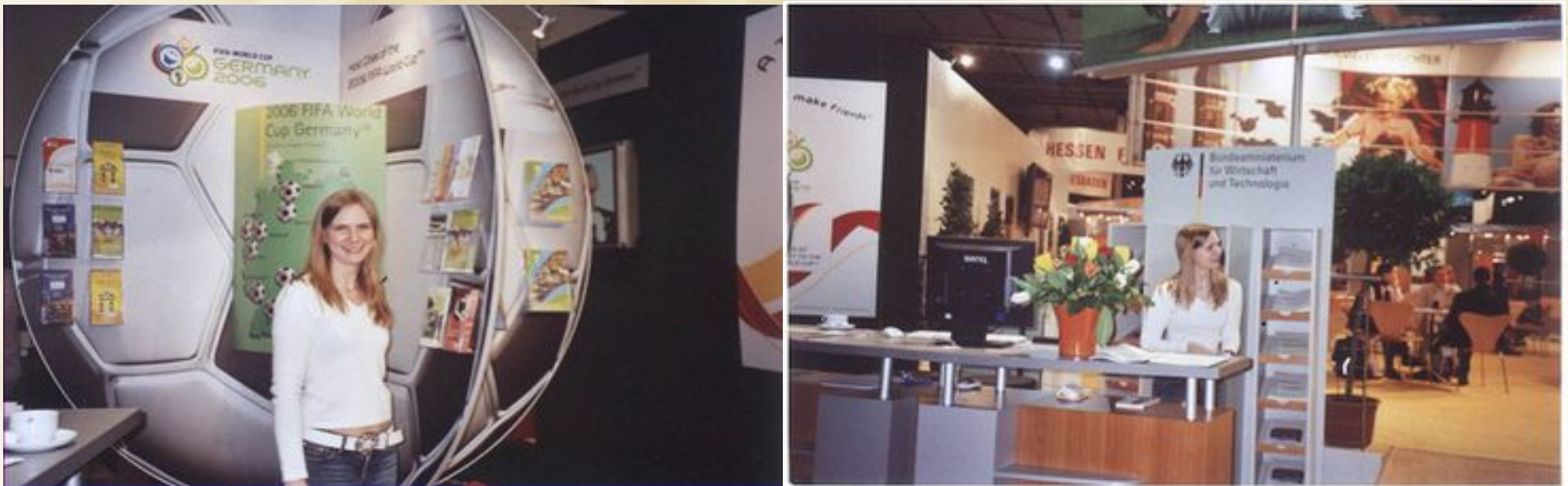
Nicoletta Bäuerle - Veranstaltungskauffrau