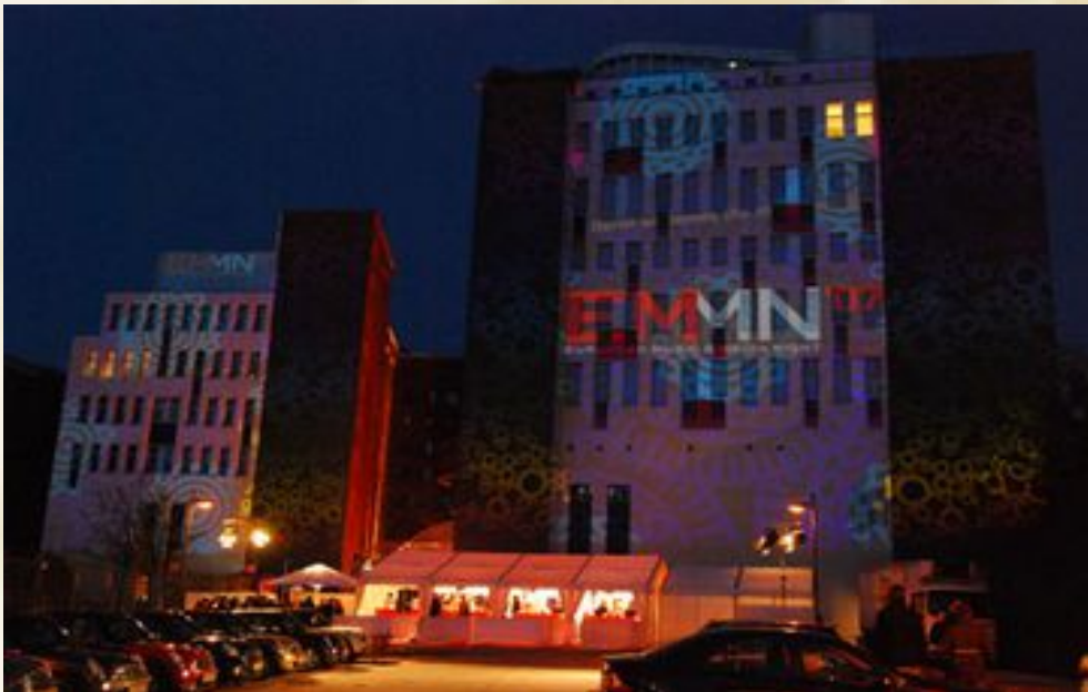
Nicoletta Bäuerle - Veranstaltungskauffrau