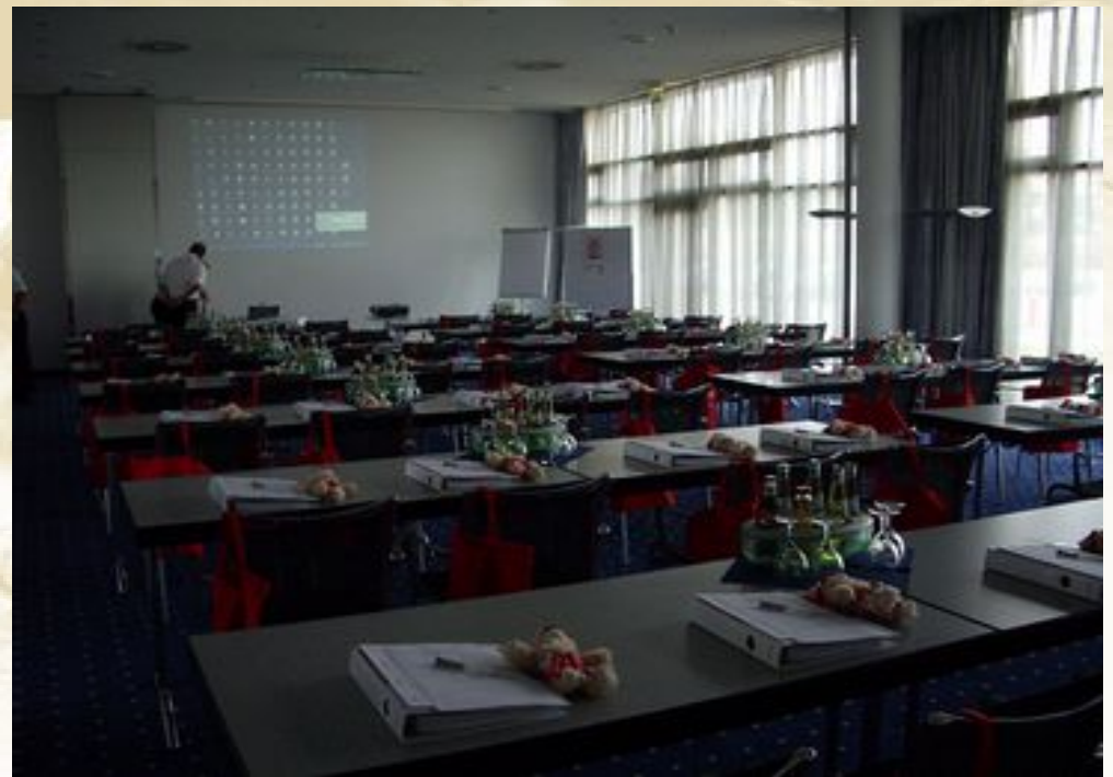
Nicoletta Bäuerle - Veranstaltungskauffrau